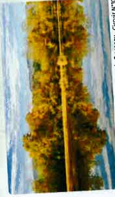
Etang de Crosagny - Circuit n°10

Départ: Albens caré igloo Distance: 33 km Dénivelé: + 920 m