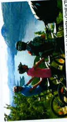
Belvédère de la Chamboote - Circuit n°11

Appréciée par les cueilleurs de châtaignes et les randonneurs, elle est le point culminant du parcours avec une altitude de 640 m. Une halte s'impose avant la descente pour admirer le point de vue sur Aix-les-Bains et le Lac du Bourget.