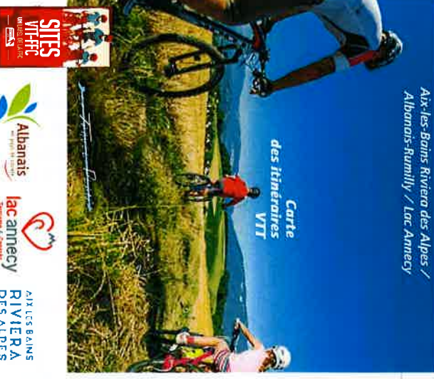
Carte des itinéraires VTT

Départ: RUMILLY Distance: 17 KM Dénivelé: - 670 M