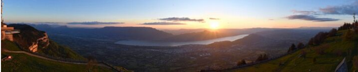
Le Revard - Station (https://www.skaping.com/grandlac/revardinfoneige)