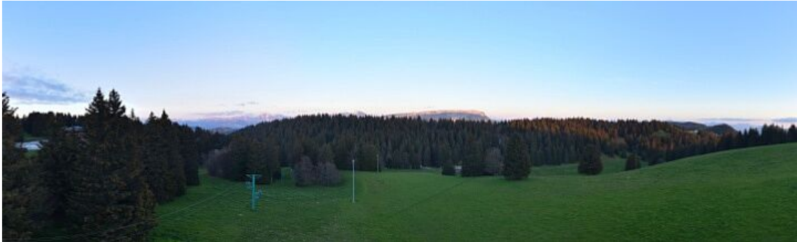
Belvédère de la Chambotte (https://www.skaping.com/grandlac/chambotte)