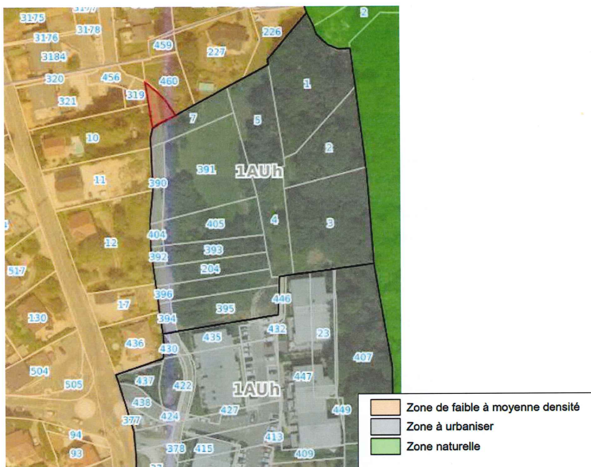
Extrait du plan de zonage du PLUi Grand Lac: