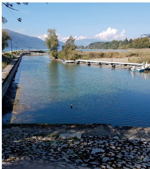
Port de Mémard (Aix-les-Bains) : lors de la baisse des niveaux du lac

Grâce à cela aucun incident grave n'a été à déplorer durant cette période. Le lac a retrouvé sa côte hivernale habituelle le 4 décembre.