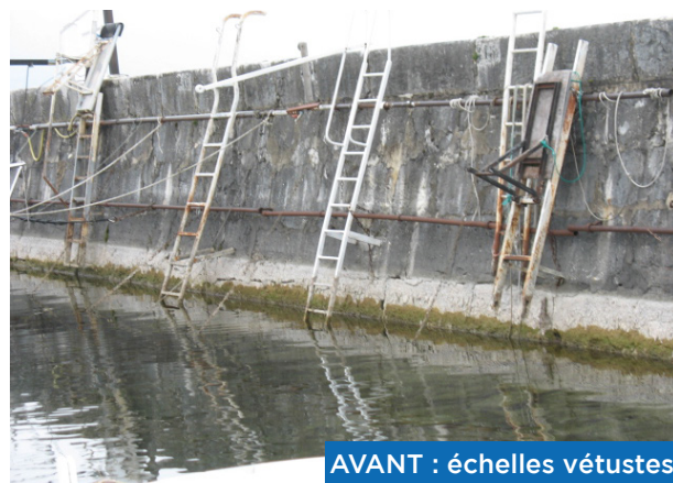
AVANT : échelles vétustes

Les travaux se sont déroulés en octobre 2018.