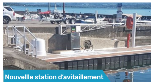
Nouvelle station d'avitaillement

Depuis mai dernier, le Petit Port d'Aix-les-Bains s'est doté d'une station d'avitaillement flambant neuve remplaçant celle acquise par la commune d'Aix-les-Bains en 1995. Un nouveau ponton d'accueil vient compléter l'équipement et permet un accostage plus confortable et sécurisé pour les plaisanciers.