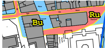
Extrait du plan du PPRI

Au titre de la prévention des risques , le plan de prévention des risques d'inondation (PPRI) du bassin aixois identifie des zones de risques Bu et Ru se superposant aux parcelles de l'OAP. Tout projet devra respecter le règlement du PPRI, annexé au PLUi.