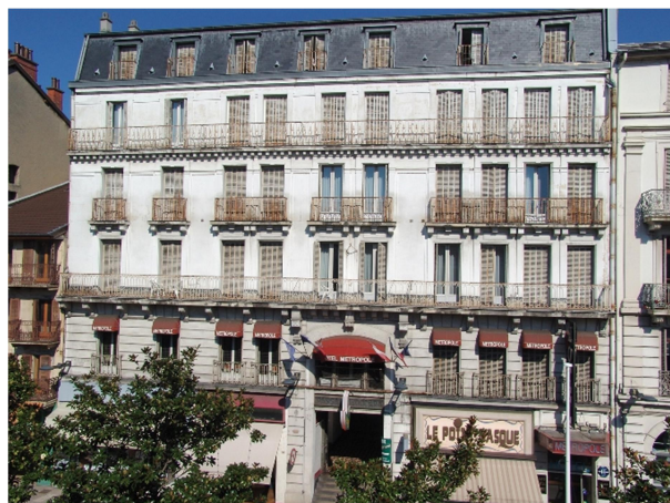
Façade historique rue du Casino