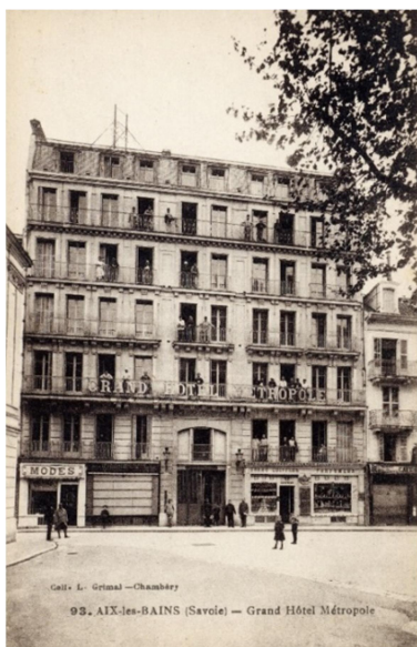
Façade historique place Carnot

Les murs séparatifs et les murs aveugles apparents feront l'objet d'une finition soignée, s'harmonisant avec celui des façades principales.